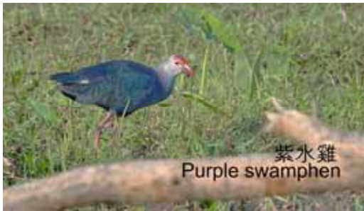
紫水雞 Purple swamphen