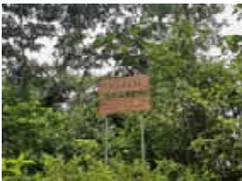
Maycu Reserve Tropical Forest

離開 Copalinga Reserve 去 Yankuam Lodge，途中如以往一樣，一邊趕路一邊觀鳥，午餐是三文治、盒裝飲品及小吃、水果。食物無問題，地點則較為特別 - 站著面對墳墓享用豐富午餐。餐後就在墓地附近觀鳥。