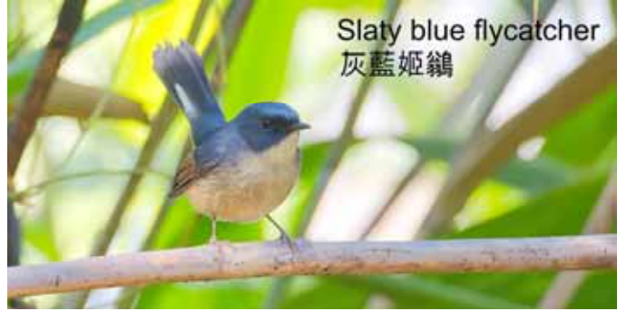
Slaty blue flycatcher 灰藍姬鶇