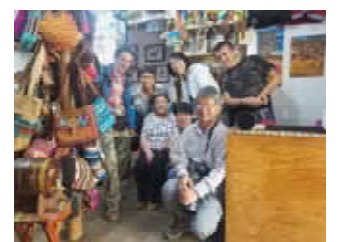
在鳥導兄弟的禮品店內

Yankuam Lodge 旅館位於 Zamora-Chinchipe 的 Nangaritzza 河上的 Orquideas 村以南 3 公里處。它包含三棟 12 個房間的建築物，最多可容納 30 人。其中四個房間設有私人浴室。