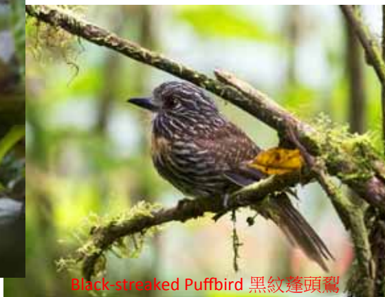
Black-streaked Puffbird 黑紋蓬頭鴉