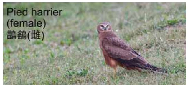
Pied harrier (female) 鵲鶇(雌)