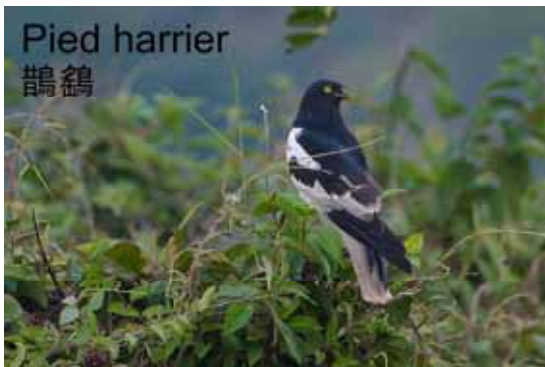
Pied harrier 鵲鶇