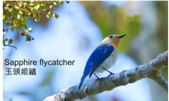
Sapphire flycatcher 玉頭姬鶇