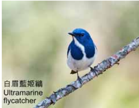
白肩藍姬鶇 Ultramarine flycatcher