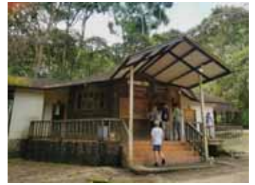
Copalinga Reserve Tropical Forest

12月6日離開 Tapichalaca Reserve 去另一保護區 Copalinga Reserve Tropical Forest，住處的旅館坐落在充滿大自然環境中，使人感到憩靜、舒服。我住的房間是一間木造的獨立屋，有一個小露台，沒有吵鬧的音樂、電視等等，只有鳥鳴蟲叫，蝴蝶花間飛舞，讓城市人在翠綠的環抱享受清新空氣。愛好雀鳥的異鄉人坐在餐廳，嘆著熱茶，看著顏色艷麗、速度快捷的小蜂鳥互相追逐已值回票價。