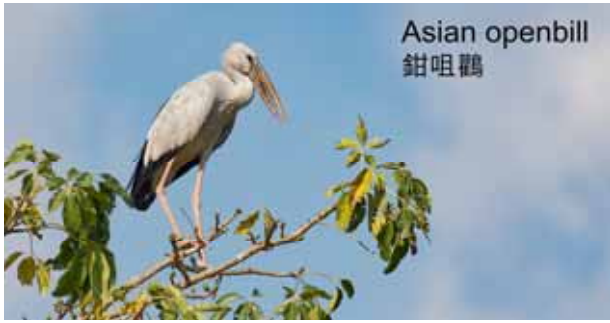
Asian openbill 鉗咀鸛