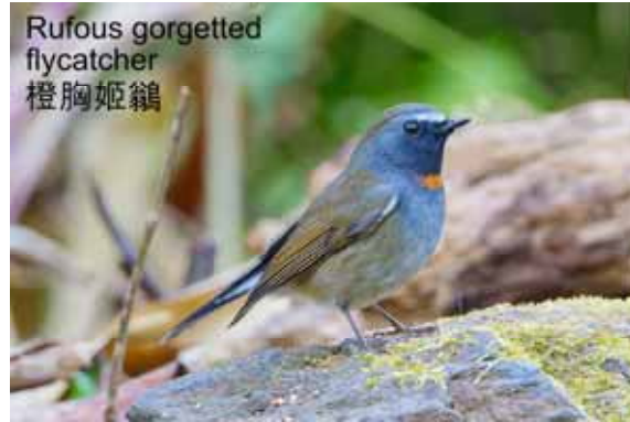
Rufous gorgetted flycatcher 橙胸姬鶇