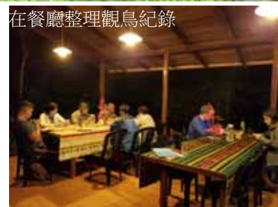
在餐廳整理觀鳥紀錄

在 Southern Ecuador 一共住了四間 Lodge，每間酒店各有特色但有一個共通點：每日定時定點放食物餵食，一些 Reserve 管理員也會定點放穀物。