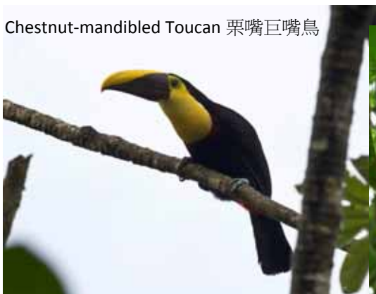
Chestnut-mandibled Toucan 栗嘴巨嘴鳥