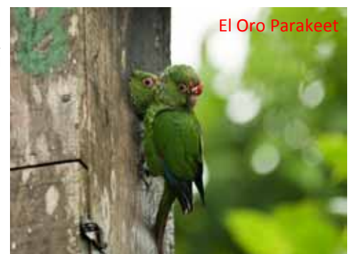
El Oro Parakeet

El Oro 長尾小鸚鵡是這省的特有種，Umbrellabird 更不可錯過，所以天未光、下雨有霧都要去等牠們。