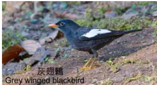
灰翅鶇 Grey winged blackbird