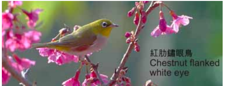
紅肋鏞眼鳥 Chestnut flanked white eye