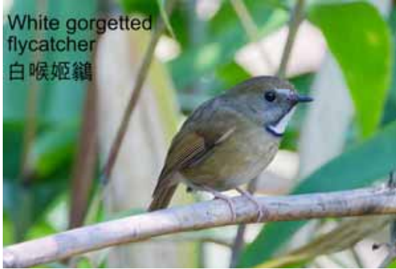
White gorgetted flycatcher 白喉姬鶇