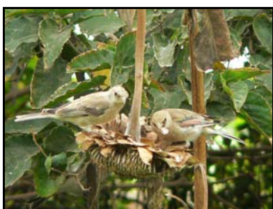
(巨嘴沙雀 - 葡萄溝)

早上六時四十五火車到達吐魯番大河縣火車站，大漠氣候多風少雨，天氣乾燥，日間炎熱，晚上較為涼快，降雨量1.6毫米而蒸發量則1400毫米。火焰山呈紫紅色，為紅砂岩構成，在烈日照耀下紅光灼灼，因刮風沙，天陰大風，竟要穿外套拍照〔早一天氣溫則是四十九度〕。葡萄溝是火焰山西側的一片峽谷，溝的兩側山坡上寸草不生，但溝內卻流水潺潺，綠樹成蔭，一串串葡萄掛滿架上。