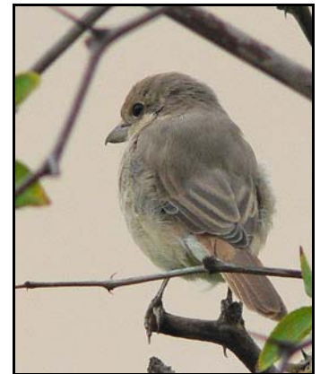
(棕背伯勞 一幼鳥 (月牙泉))