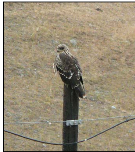
(白頭鶴 - 南山牧場)