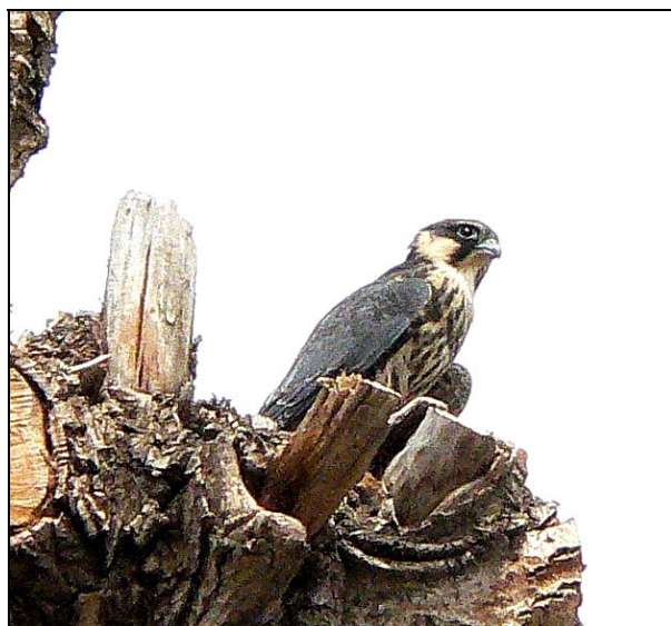
(雷台古墓 - 燕隼)

古墓旁有數棵高聳入雲的箭楊樹(生一千年、死一千年)，燕隼在枯樹橫枝築巢為家，三隻幼鳥互相嬉戲、理羽，成鳥則在旁俯視著一群癡人，癡人們則不停為牠們拍照。導遊小姐也來湊高興，看個不亦樂乎。梁潔貞發揮紅耳鶉精神向她介紹我會早晨觀鳥活動。