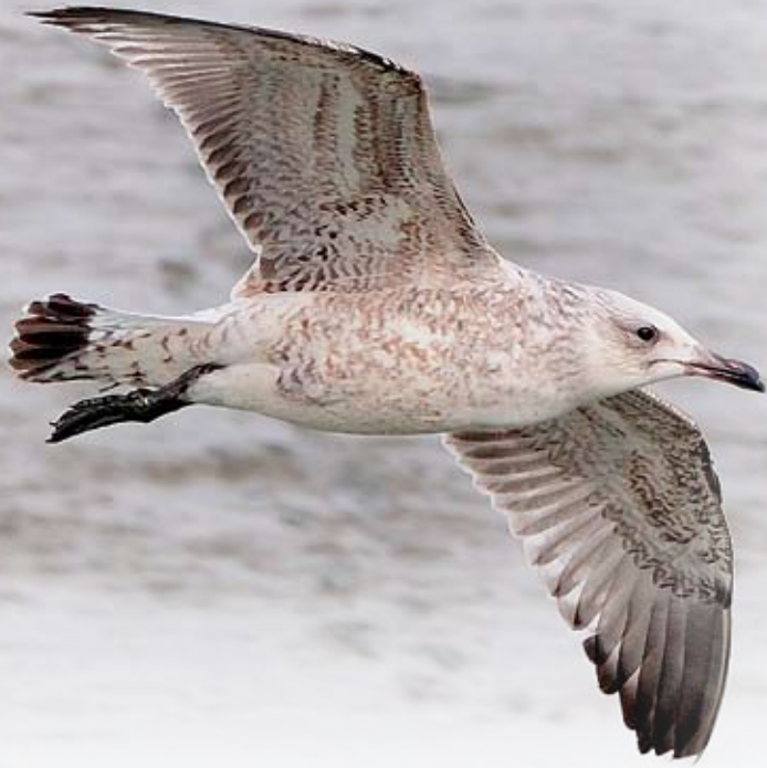
黃腳銀鷗 施文漢 南生圍

Yellow-legged Gull Sze Man Hon Nam Sang Wai