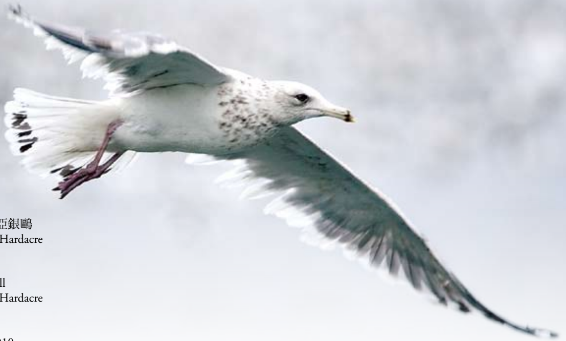
西伯利亞銀鷗 米埔