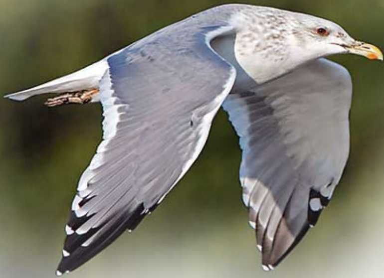
烏灰銀鷗 張冠南 南生園