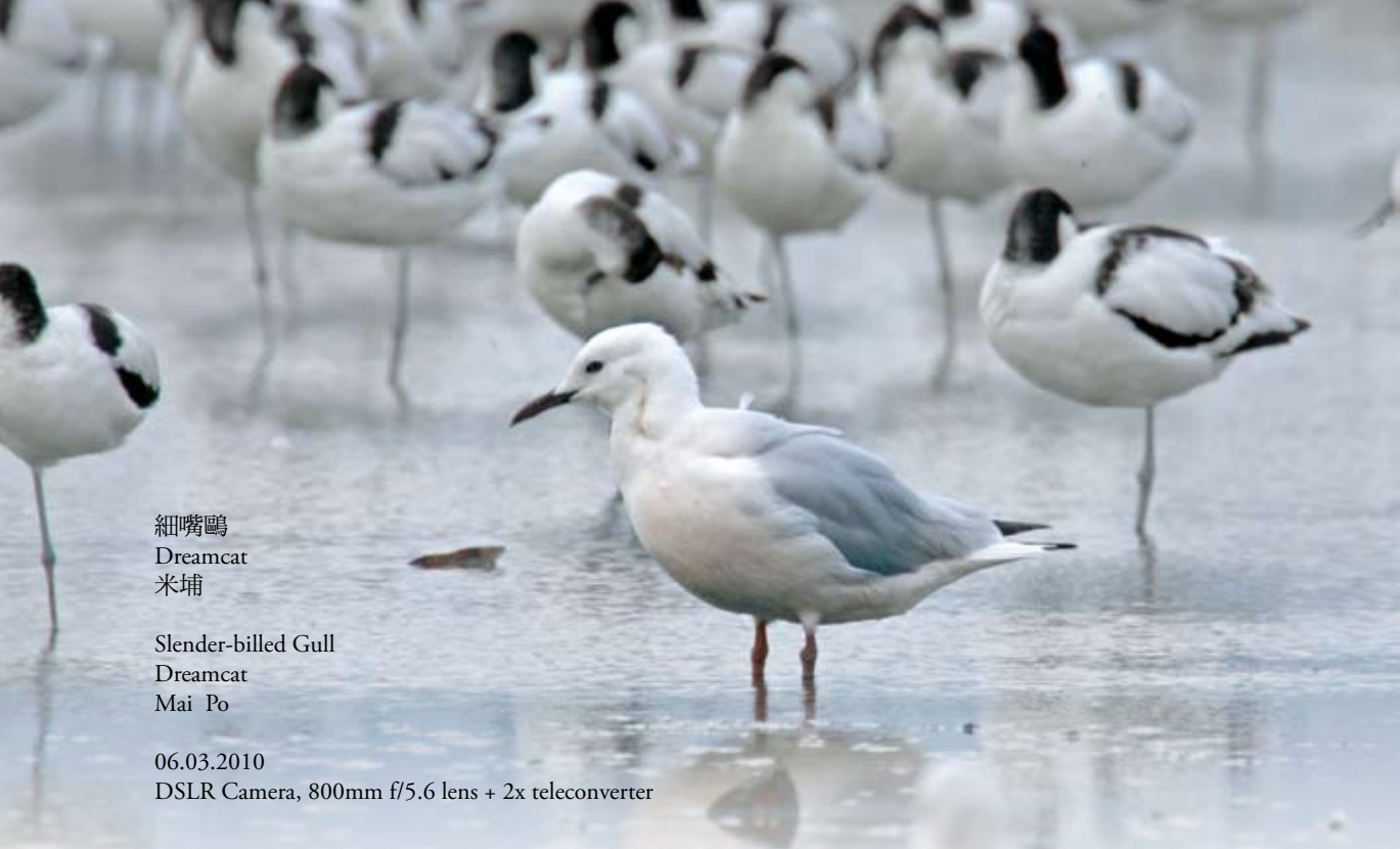
細嘴鷗 Dreamcat 米埔