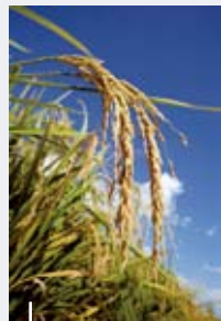
金黃色的稻穗