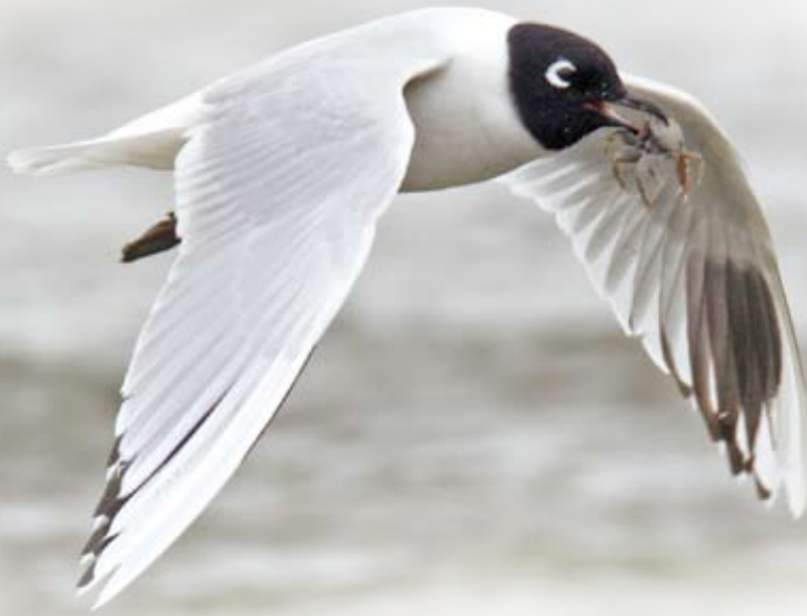
黑嘴鷗 米埔

Saunders's Gull Mai Po