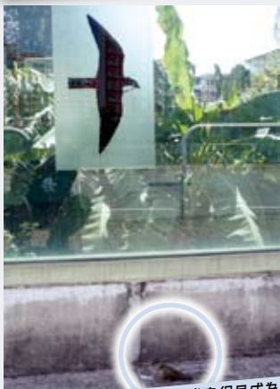
誤撞後受傷的雀鳥很易成為獵物。