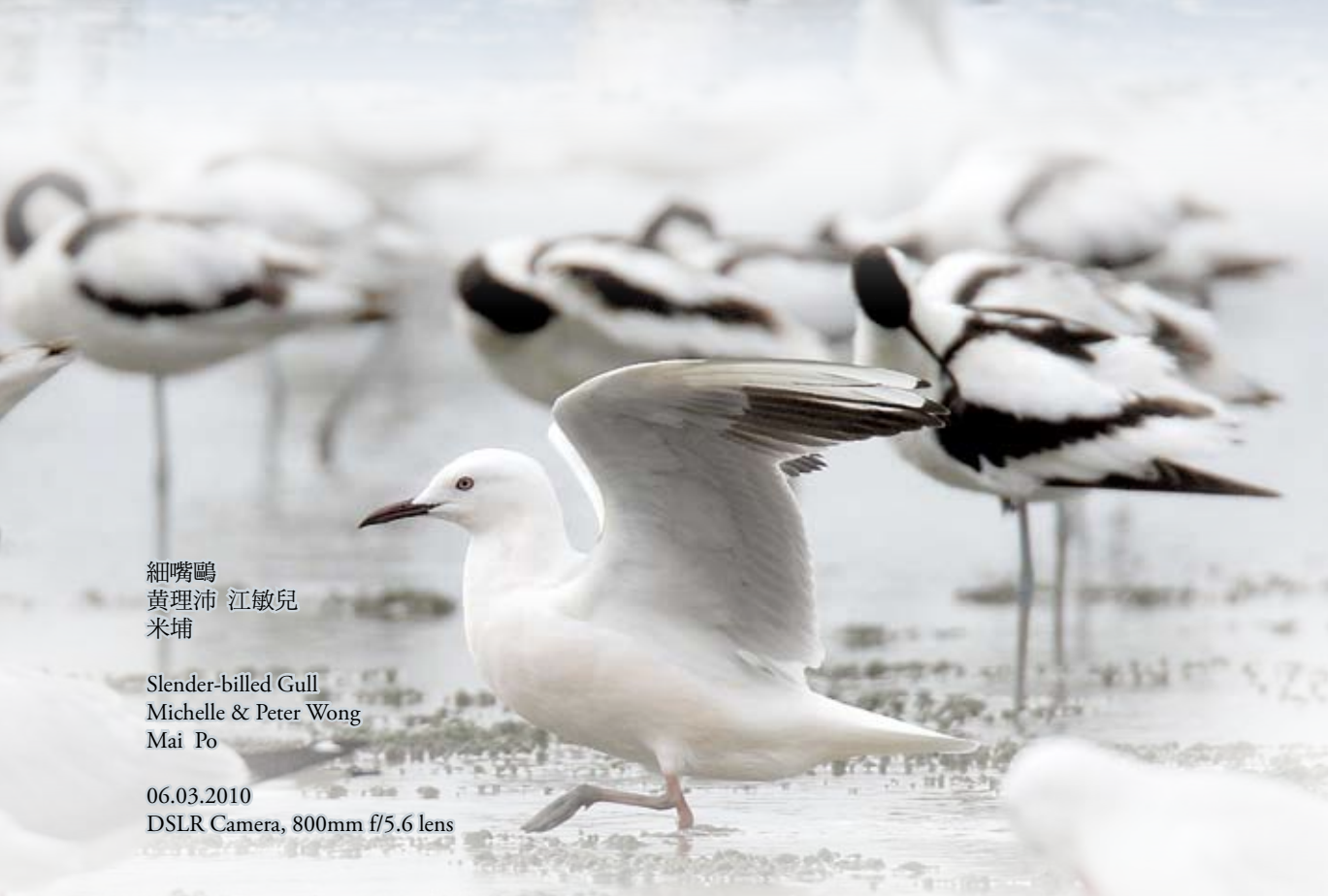
細嘴鷗 黃理沛 江敏兒 米埔

06.03.2010 DSLR Camera, 800mm f/5.6 lens + 2x teleconverter