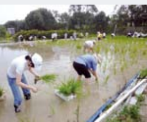
稻米種植的各個程序都是舉行體驗活動的好機會

今年七、八月，我們安排了數次稻米收割活動，將早造稻米收割好，然後再整田，預備種植晚造稻米，為秋季遷徙作好準備。我們將會安排更多不同類型的教育活動，請密切留意網上討論區。