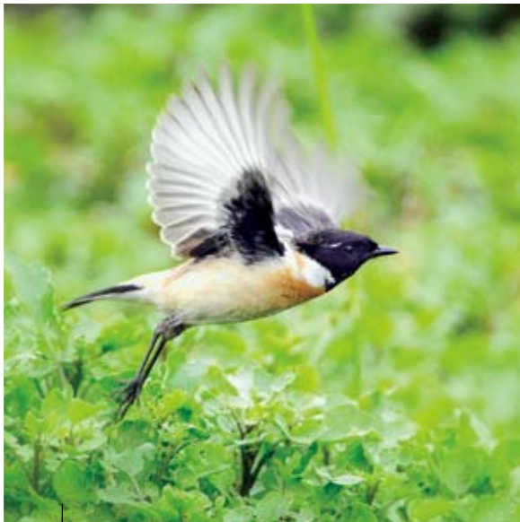
草鷺 文權溢 濕地公園

16.6.2010 DSLR Camera, 500mm f/6.3 lens, ISO200