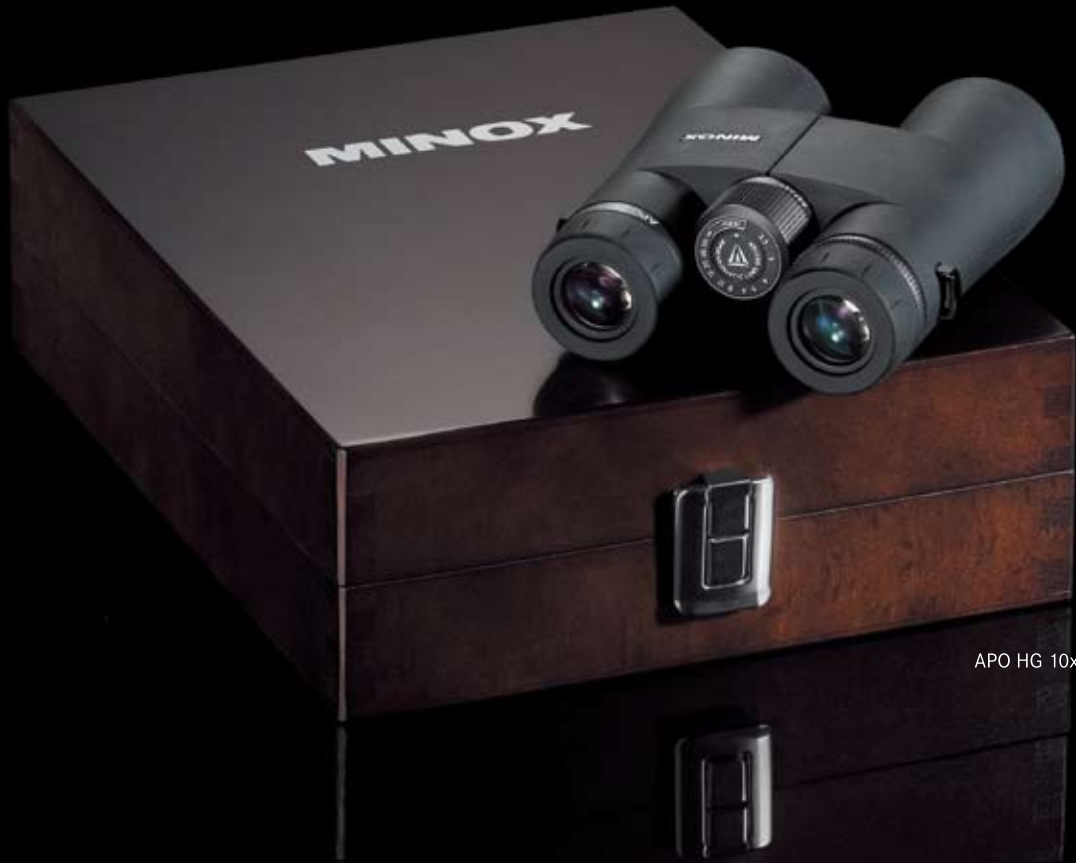
APO HG 10x43 BR