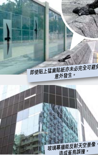
玻璃幕牆能反射天空景象，造成雀鳥誤撞。