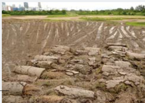
已修復的淺水生境

在管理決策的過程中，基金會重視觀鳥或攝影等人士提供的寶貴意見。如閣下收集到的有用的觀察資料，歡迎將資料傳遞給基金會管理隊任何一位成員。