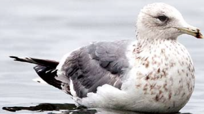
西伯利亞銀鷗 Andrew Hardacre 米埔

30.03.2010 DSLR Camera, 800mm f/5.6 lens