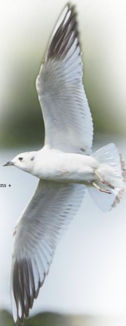
黑嘴鷗 施文漢 南生圍

19.02.2010 DSLR Camera, 800mm f/5.6 lens