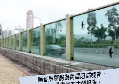
隔音屏障能為民居阻擋噪音，但也是雀鳥的大型陷阱。