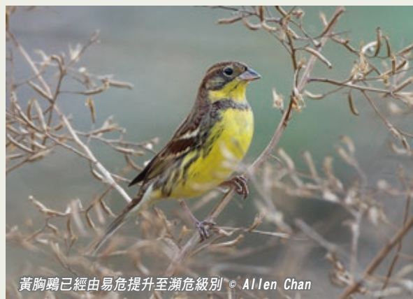
黃胸鵪已經由易危提升至瀕危級別

今年秋天(9-11月)我們會繼續「數數鵪」的活動。由於國際自然保護聯盟(IUCN)決定將黃胸鵪由易危提升至瀕危級別，我們將於11月2-3日舉行「禾花雀大搜查」，以統計全港(主要為新界北和西北部)的黃胸鵪數量，此活動亦是響應國際鳥盟的「歡迎候鳥」活動。有關活動詳情請瀏覽網上討論區： http://www.hkbws.org.hk/BBS/forumdisplay.php?fid=38&page=1