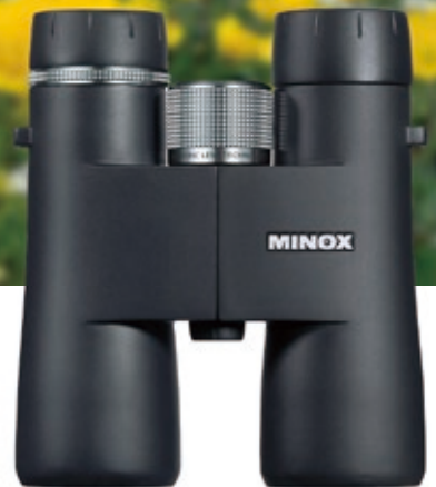
MINOX HG 10x43BR