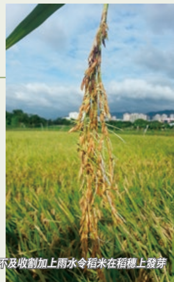
趕不及收割加上雨水令稻米在稻穗上發芽

今年的雨水好像特別多，七月連續多天的不穩定天氣，令原定的稻米收割時間未能依期進行，在人手不足的情況下，又要躲避突如其來的雷雨，令整段收割期拖延了不少時間，加上潮濕的天氣，令一些稻米還沒有收割就已經在稻穗上發芽。另外，因為沒有陽光把收割好的穀粒曬乾，部分穀粒亦發芽或變壞了。接下來的晚造插秧在8月完成了。同事和義工充分體會農夫要「睇天做人」的艱辛。