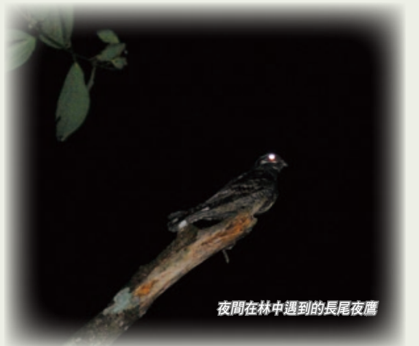
夜間在林中遇到的長尾夜鷹