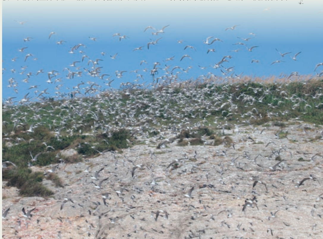
浙江韭山列島國家級自然保護區中的中華鳳頭燕鷗恢復項目招引地吸引了過千隻鳳頭燕鷗。

我們決定於會議完結後次日再次考察項目地，發現至少有1,000隻大鳳頭燕鷗和5隻中華鳳頭燕鷗在我們的招引地點上棲息。小島上的監測在牠們全部遷徙之前仍會繼續進行，這標誌著國內首個人工引導海鳥選擇繁殖地的第一個成功案例。