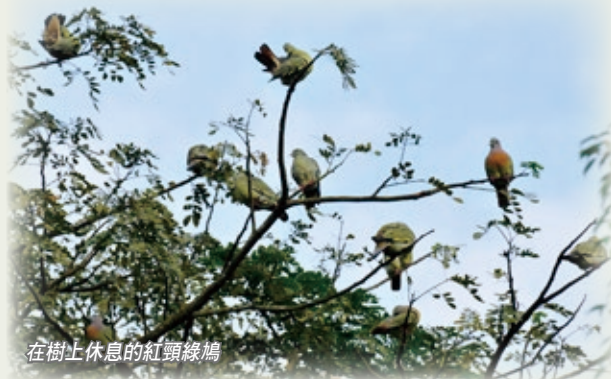
在樹上休息的紅頸綠鳩

多年來因為工作關係我到訪過新加坡多次，而每一次的主要目的都是探索當地的自然生態。與香港相似的是，新加坡的城市和郊區距離十分近，而且亦擁有紅樹林、樹林和大型的市區公園，但和香港最大的分別是新加坡擁有接近赤道地區的熱帶氣候，以及保留了部分原始森林。