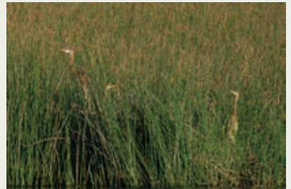
離巢後的三隻草鶯幼鳥

相反，今年夏季一些雀鳥卻在保護區築巢及繁殖。我們發現保護區存有草鶯的鳥巢，這是首次確定草鶯在香港繁殖。這對繁殖草鶯在2013年成功育有三隻雛鳥，直至現在，共有六隻雀鳥在今年夏季定時出現。此消息尚未外傳，以免造成滋擾及影響雀鳥繁殖。我們期望這些雀鳥下年再歸來，並帶來同伴，最終可建立種群。