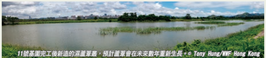
11號基圍完工後新造的濕蘆葦叢，預計蘆葦會在未來數年重新生長。

一些水鳥如草鶯喜歡在大片濕蘆葦叢生活，而8b號基圍內的濕蘆葦叢可能就是牠們今年到來棲息的原因之一。第277期通