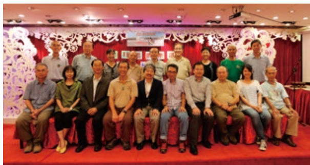
紅耳鸚現屆委員與嘉賓合照