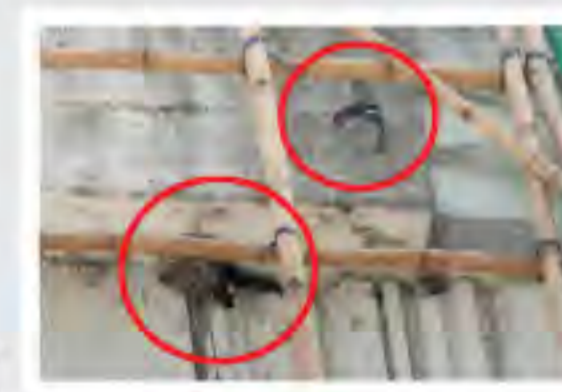
搭建在燕巢前的工程構架，阻礙了這對小白腰雨燕進出燕巢，最終導致牠們棄巢。

而且從「家」燕的中文名字及小白腰雨燕的英文名字「House」Swift中也顯示了牠們跟我們的「家」或者「屋」，有著深厚的關係，是我們的老朋友。」