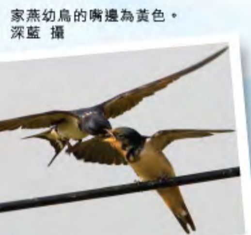
家燕幼鳥的嘴邊為黃色。