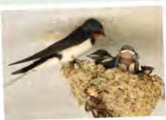
家燕一巢通常生2-5隻幼鳥，但有時也可以多至7隻。

家燕由頭至尾部及雙翼均呈帶光澤的深藍色，額及喉部紅褐色，胸至下體白色。家燕飛行能力雖強，但腳短小兼軟弱無力，只能在地上、電線或欄杆上站立，卻不會在地面行走。喜愛大群出沒，有時候會過千隻聚集。經常在濕地、溪流、開闊原野和高地飛行覓食。