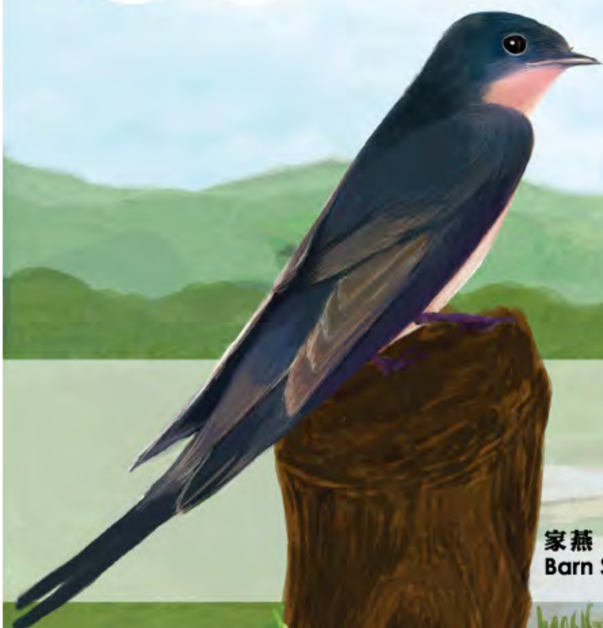
家燕 Barn Swallow