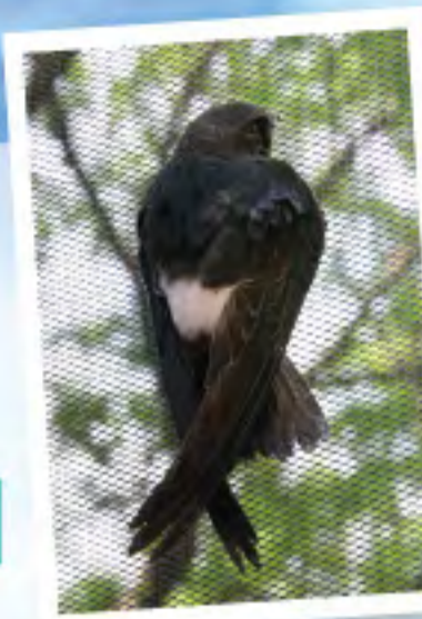
小白腰雨燕的特徵是腰部有一寬白色橫帶。