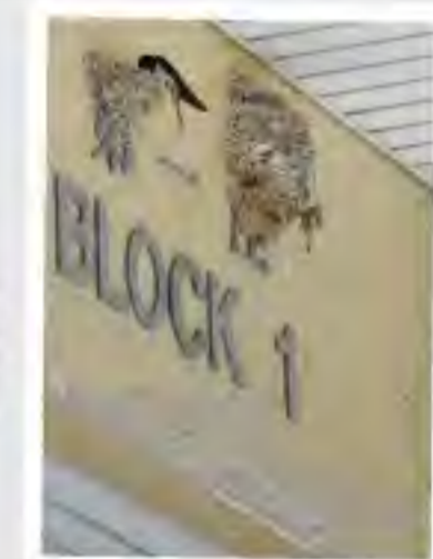
青衣某屋苑管理處在燕巢下加裝透明膠片以盛載鳥糞，令路過燕巢下的住客不會被鳥糞弄污。