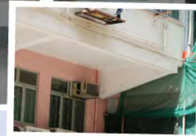
舊式建築物的「騎樓底」對於在市區繁殖的燕子是重要的營巢地方，可惜現在已越來越少了。