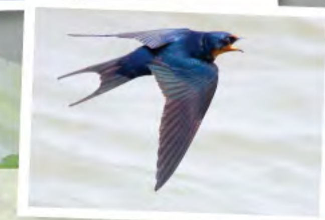
飛行中的家燕正張開口捕食在眼前飛行的昆蟲。