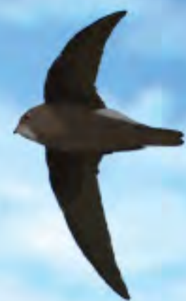
小白腰雨燕 House Swift