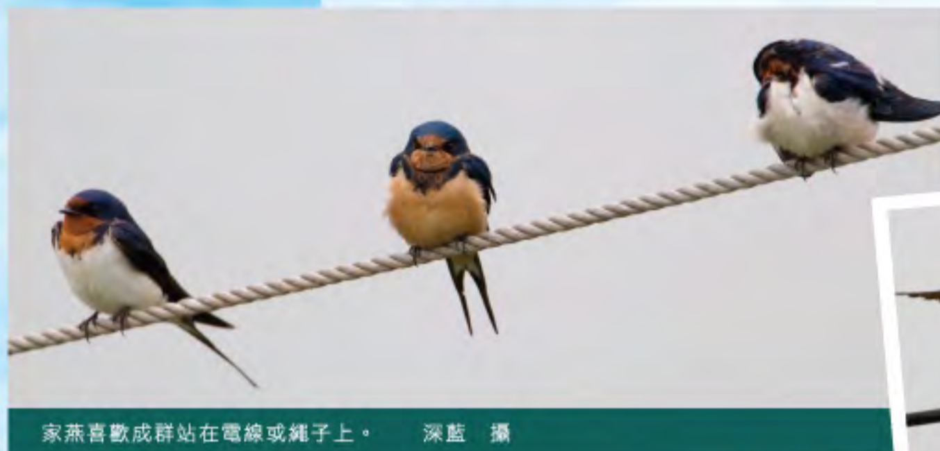
家燕喜歡成群站在電線或繩子上。