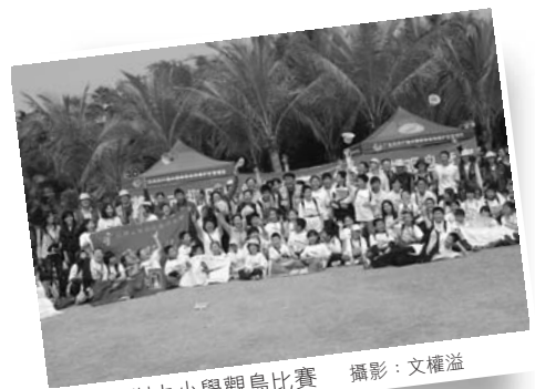
深圳中小學觀鳥比賽