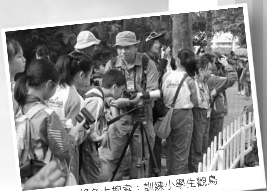
綠色大搜索：訓練小學生觀鳥

本會繼續與香港公園合辦「綠色大搜索」活動，內容包括半天的觀鳥訓練及半天比賽，日期為2007年12月16(訓練)及23日(比賽)，今年的參加者共16隊約八十位小四至小六學生，在香港公園尋找這些大自然寶貝並同時尋找一些有關動植物問題的答案，既興奮又有趣味。謹此所有參與活動的紅耳鸛組員及其他義工。冠軍隊伍來自聖嘉祿學校。