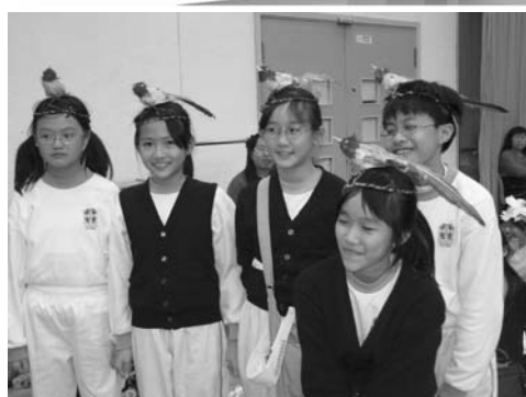
冠軍聖嘉祿學校製作的雀鳥帽子也同時得最佳設計獎

本會獲主辦機構邀請，首次參與在南韓瑞山市清水灣(Cheonsuman)舉行的國際觀鳥節2007，日期為10月26至28日，是次觀鳥節是首次邀請外地鳥會出席，除香港外，亦有來自台灣、日本、新加坡、菲律賓和美國德薩斯州的鳥會參與。