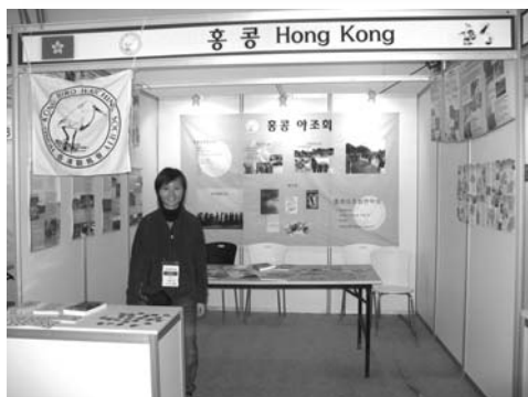
南韓瑞山國際觀鳥節