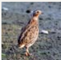
在塋原拍得的鸕鶿