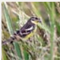
黃胸鵪在稻米田覓食

管理計劃進入最後階段，管理農地面積漸漸穩定，各項管理措施亦見效果，夏天種植的稻米在九月下旬開始長出稻穗，更吸引約十隻黃胸鵪前來覓食，是自2005年管理以來錄得最高的黃胸鵪數量，實在令人振奮。除此之外，我們還記錄到一些較少在塋原出現的過境遷徙鳥，如鸕鶿、黑腹濱鵪、北鸚、澤鵪、水雉等等。我們鼓勵各鳥友和攝影者多在網上討論區分享塋原的觀鳥成果和報告，讓我們有更全面的記錄。