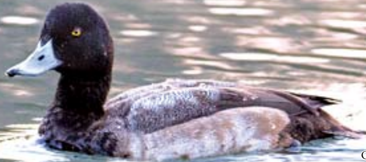
斑背潛鴨 吳璉宥 貝澳