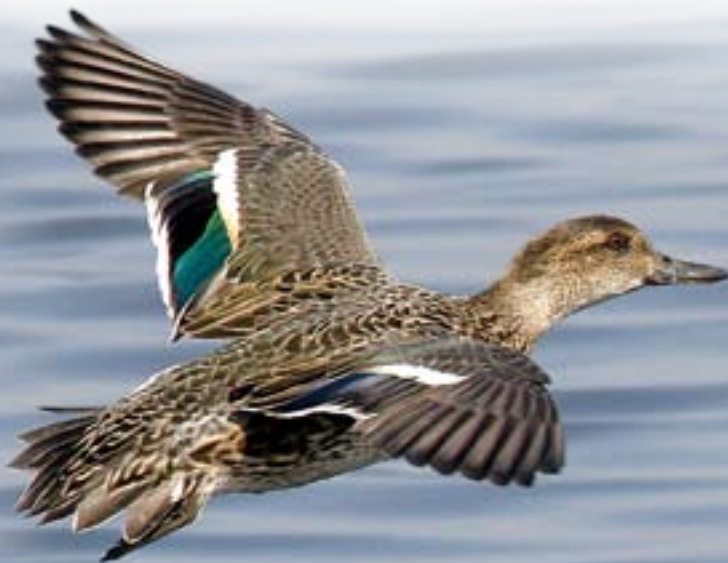
綠翅鴨 葉紀江 南生圍

SLR Camera, 600mm f/4 lens + 1.4x teleconverter