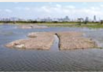
21號基圍內的島嶼

21號基圍已正式以潮漲棲息地模式運作。這是米埔歷來最大型及最昂貴的單一基圍工程，耗資約港幣一百五十萬，歷時兩年。