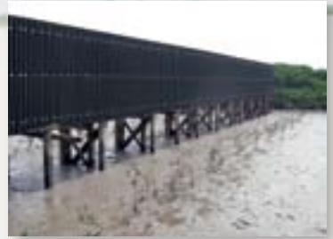
更新圍欄及種植紅樹

今年初冬，通往新浮動觀鳥屋的连接路進行大規模改善工程（見圖一）。工程包括在通道兩側加建綠色圍板，在視覺上全面分隔遊人及雀鳥，並且減少人為腳步聲。另外，計劃沿途種植紅樹，逐漸建立一道自然屏障，期望將來可全面取替綠色圍板。