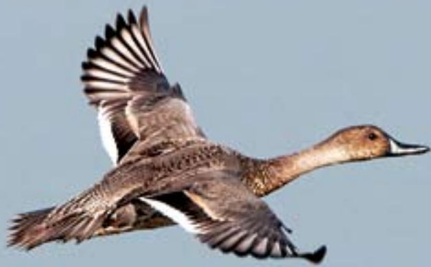
針尾鴨 張冠南 南生圍

Northern Pintail Cheung Koon Nam Nam Sang Wai