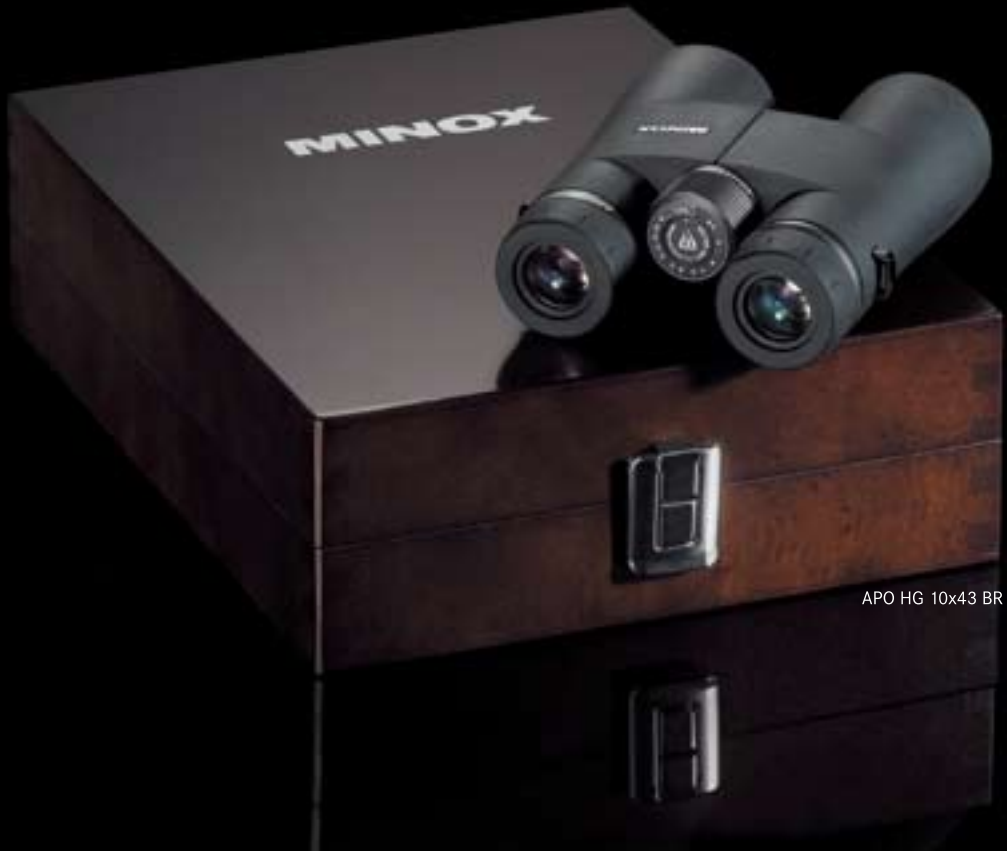
APO HG 10x43 BR

German-engineered Minox binoculars show the many advantages of years of expertise in optical and precision engineering applied in a modern design.