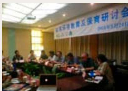
為當地教師舉辦環境教育培訓工作坊

控制家鴉數量，清除外來物種，是保護本地生態多樣性的重要行動。我們認為清除家鴉巢是最有效的方法。希望未來繼續可以與漁農自然護理署合作控制家鴉數量，維持本地生物多樣性的平衡。