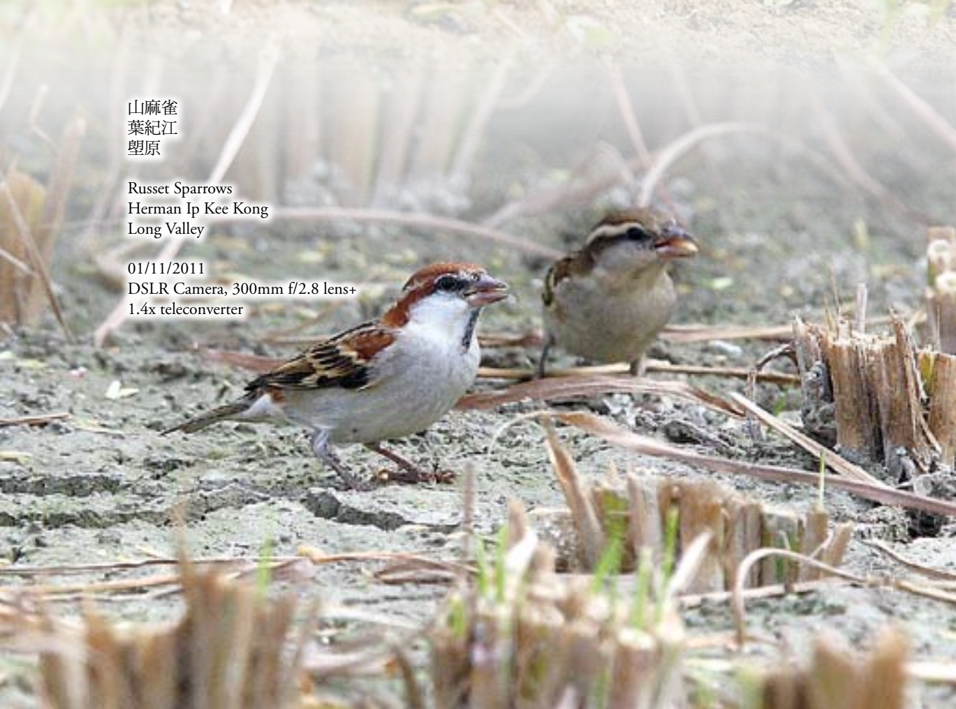
山麻雀 葉紀江 塋原

27/09/2011 DSLR Camera, 300mm f/2.8 lens+ 1.4x teleconverter