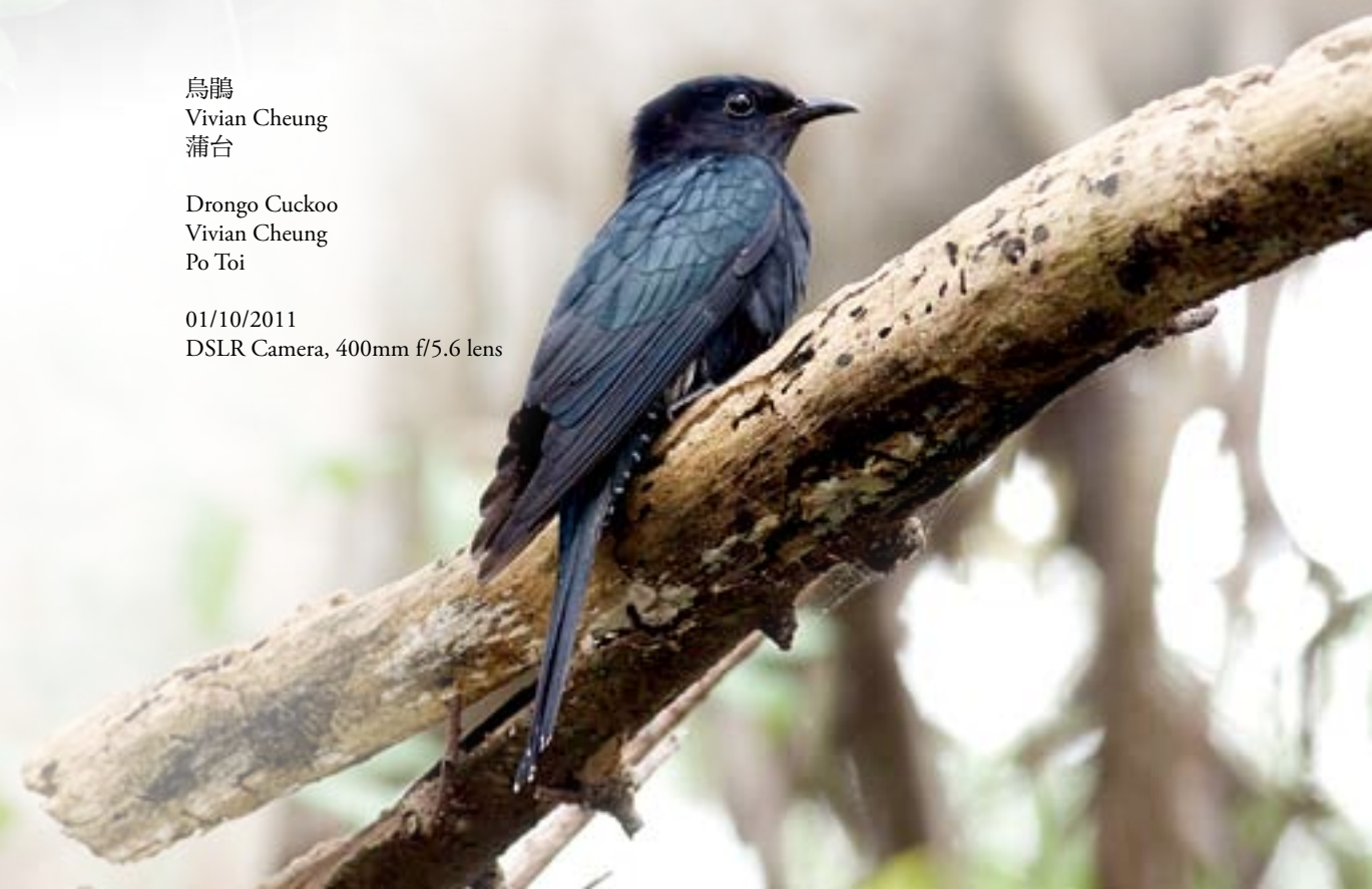
烏鵲 Vivian Cheung 蒲台

03/09/2011 DSLR Camera, 300mm f/4 lens + 1.4x teleconverter