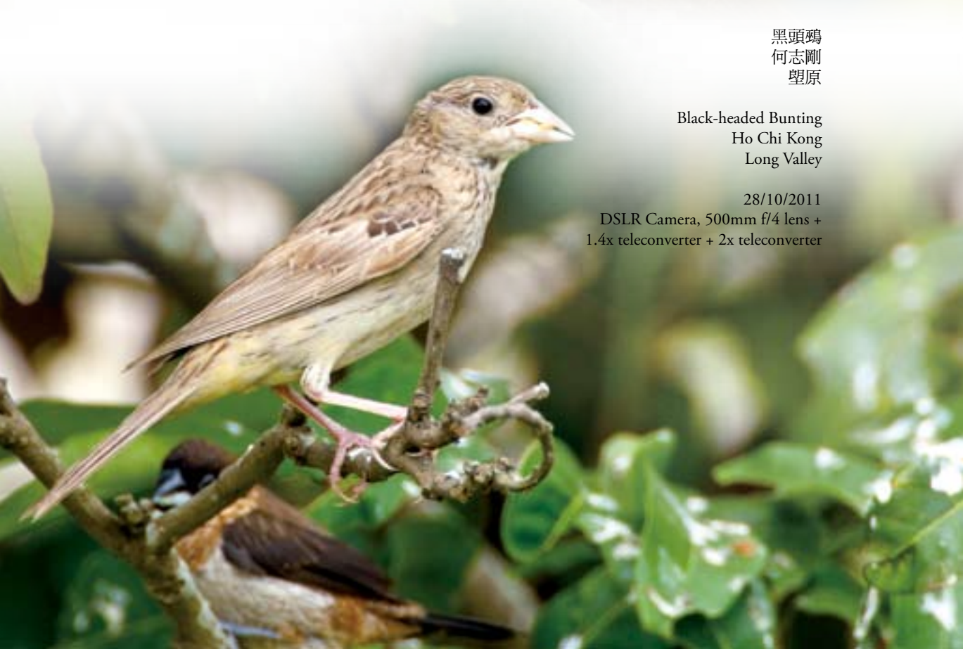
黑頭鵯 何志剛 壆原

Black-headed Bunting Ho Chi Kong Long Valley