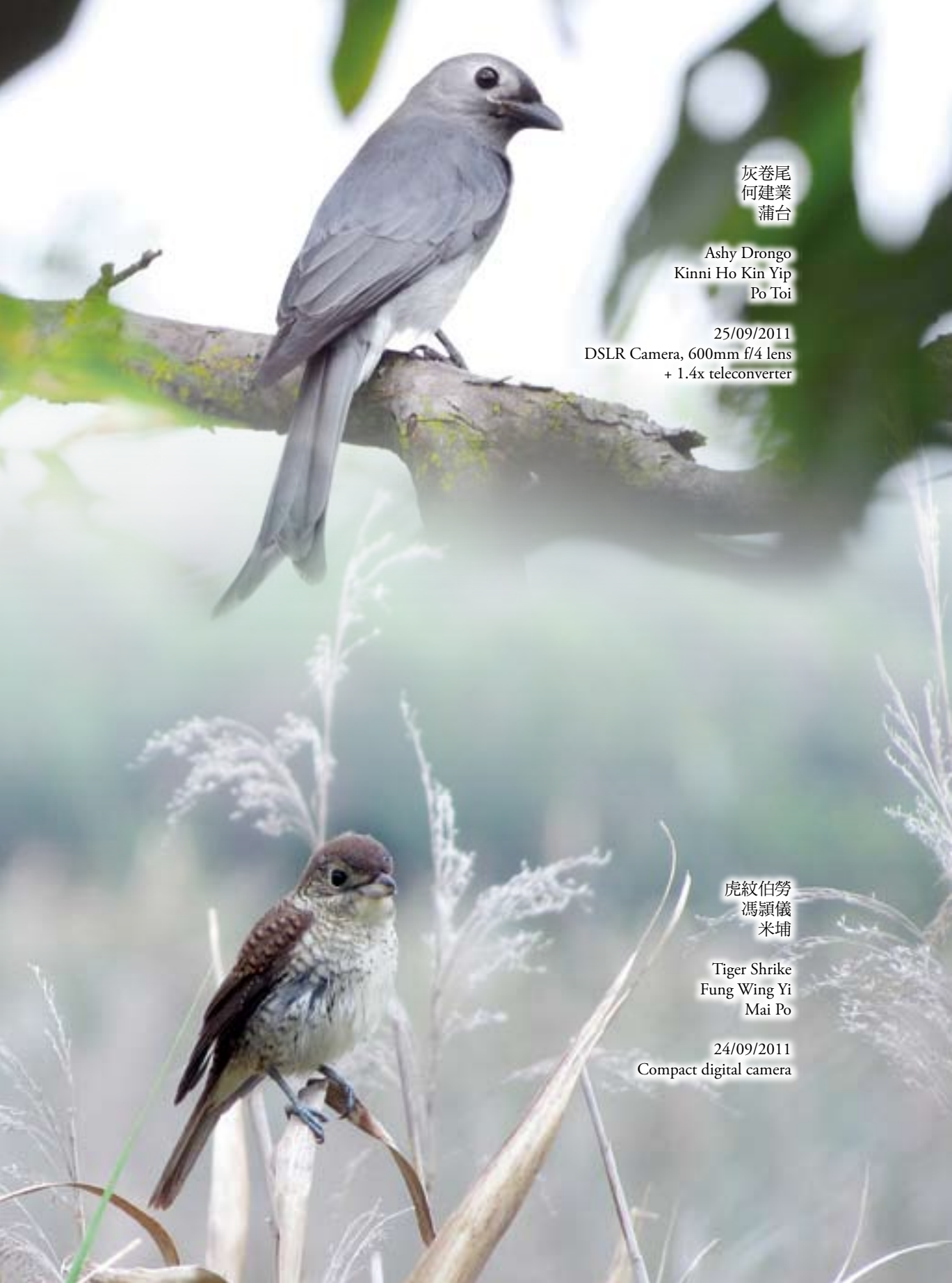
灰卷尾 何建業 蒲台