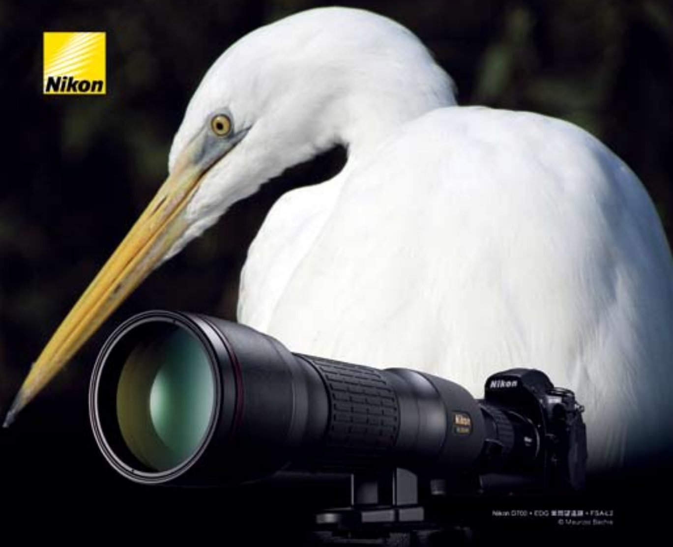
Nikon D700 + EDG 單筒望遠鏡 + FSA-L2