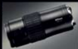
數碼單鏡反光相機連接器 FSA-L2

藝康 EDG 單筒望遠鏡系列，除讓你進行一般觀察外，更能接連數碼相機作數碼觀測，完美捕捉遠距影像。嶄新尖端的光學技術，配以設計精巧的鏡筒及無瑕對焦準確度，締造每個絲毫畢現的銳利畫面。如此絕倫，唯有藝康，唯獨 EDG。