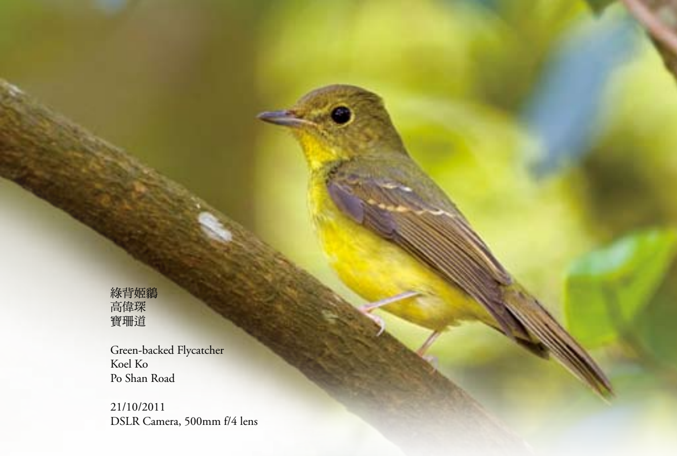
綠背姬鵙 高偉琛 寶珊道

Green-backed Flycatcher Koel Ko Po Shan Road