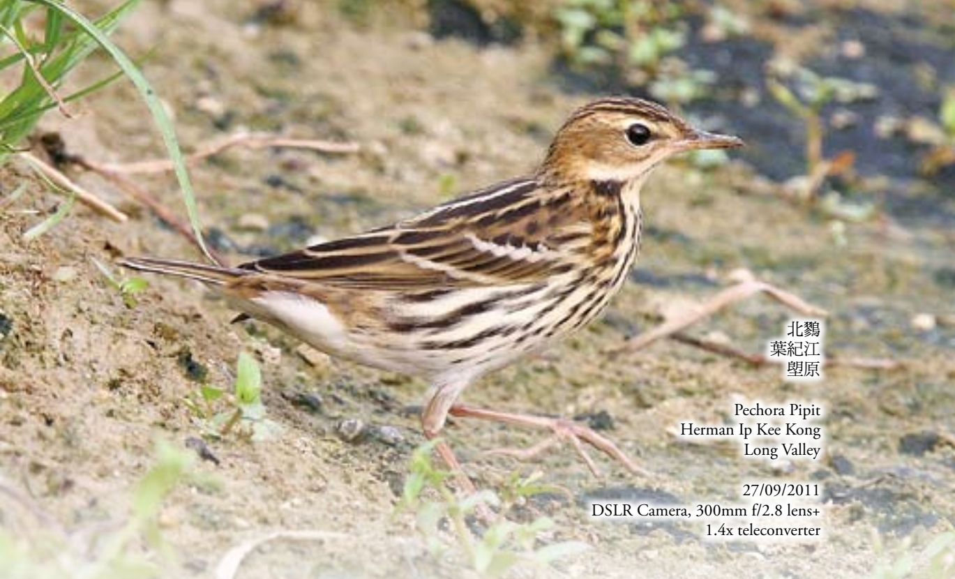
北鷓 葉紀江 塋原

Pechora Pipit Herman Ip Kee Kong Long Valley