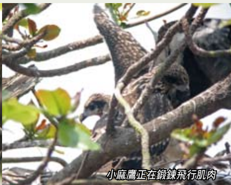
小麻鷹正在鍛鍊飛行肌肉