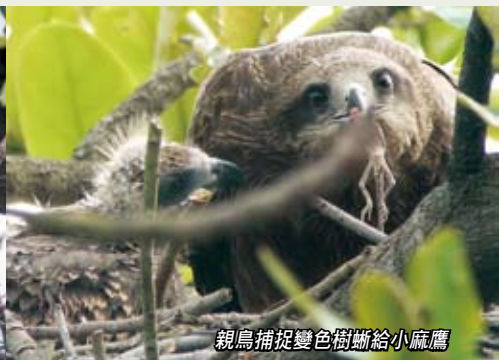
親鳥捕捉變色樹蜥給小麻鷹