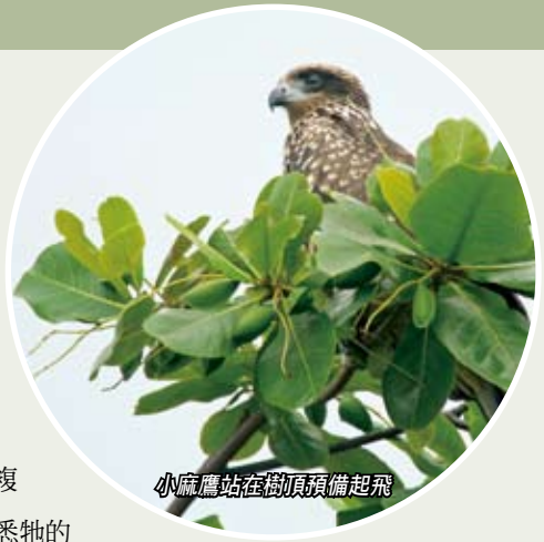
小麻鷹站在樹頂預備起飛

七星期後，小麻鷹開始由巢內爬到樹頂，把細小的雙翼張開，像感覺氣流經過翅膀產生升力，然後想跳起，但是開始起飛前，小麻鷹還沒有勇氣進行「第一跳」！經過數次起飛前的訓練後，就開始跳離樹枝，不斷亂拍雙翼，直至失控掉到旁邊的樹枝上。小麻鷹沒有因此而氣餒，重複爬到樹頂，再試飛，經過一星期後，小麻鷹開始熟悉牠的