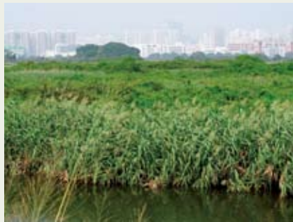
攀爬植物覆蓋#8b基圍內的蘆葦叢， 令其生態價值下降。