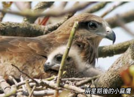
兩星期後的小麻鷹

剛破殼的小麻鷹，一雙腳還沒有活動能力，首數天只能伏在巢內，而且身上沒有供飛行的羽毛，只有白白的絨毛，身體無法抵禦寒冷的天氣，由雌鳥留在巢內替小麻鷹保暖，即使到晚上，雌鳥會留守巢內，不離不棄。而雄鳥知道小麻鷹出世後，便忙於在附近獵食。親鳥給小麻鷹的食物種類非常多元化，親鳥看見什麼能吃的，差不多全部帶回巢內餵食。