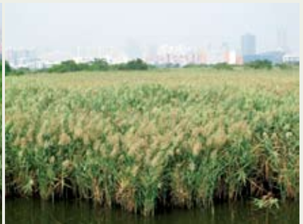
#8b基圍內的蘆葦叢具有高生態價值

近年來，保護區大部分蘆葦叢受到不同植物侵佔，以紅樹鹵蕨（ Acrostichum aureum ）、不同陸生樹及攀爬植物為主。蘆葦叢面積因而減少，同時也減少對雀鳥及無脊椎動物所帶來的生態價值，#8，#10及#11基圍的情況尤其嚴重。