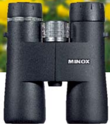
MINOX HG 10x43BR