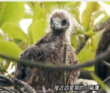
接近四星期的小麻鷹

小麻鷹出世四星期後，真正的羽毛開始生長，與一星期前白雪雪的絨毛比較，可說是煥然一新！這個時候，牠們要開始鍛鍊飛行肌肉，開始在巢內練習拍翼動作。雌鳥會因小麻鷹的羽毛開始生長，能夠自行保暖，晚上漸漸地離開小麻鷹，飛到附近的晚棲地晚棲，而小麻鷹要嘗試獨留在巢內晚棲，直到翌日早上親鳥回來送上第一份早餐。