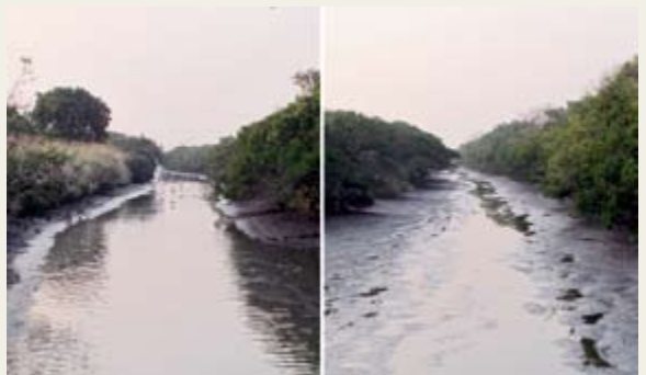
(左圖)13號基圍水道正處於排水階段。(右圖)擬於2014年清除水道內淤泥。