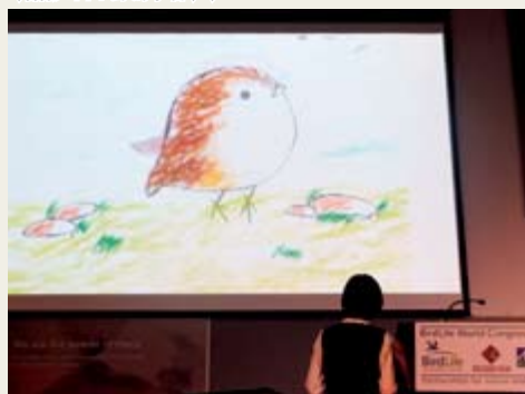
動畫於2013年6月20及22日在加拿大渥太華舉行的國際鳥盟世界大會上首播