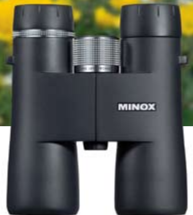
MINOX HG 10x43BR