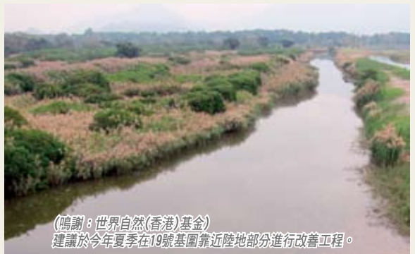
建議於今年夏季在19號基圍靠近陸地部分進行改善工程。