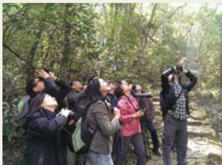
第三期林鳥辨識工作坊戶外考察

第十六期《雀躍蒼》觀鳥訓練證書課程基礎班已於3月底完結，共為25位參加者提供了基礎觀鳥訓練。第三期林鳥辨識工作坊及第二期田野鳥類辨識工作坊亦已分別於1月及3月舉行，兩工作坊為一共35名會員提供了進階的觀鳥訓練。而在4月份，本會將推出全新的涉禽工作坊，詳情見本會討論區活動欄。