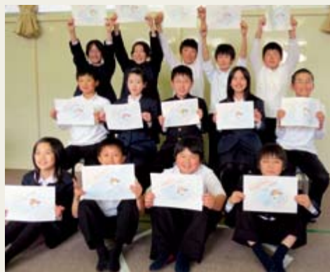
小動畫1—日本的小孩拿著他們塗上了顏色的圖畫

小動畫在2013年6月於加拿大渥太華舉行的國際鳥盟大會上首播，並於1月20-24日在印度舉行的第9屆國際兒童電影節（環境與野生動物類別）中入選為播映作品。本片（片名："Journey of Spoon-billed Sandpiper"）已放在Youtube ( http://www.youtube.com/watch?v=INu1Z5xHeWQ ) 和優酷網 ( http://v.youku.com/v_show/id_XNTc5MTY5NDk2.html ) 供下載作為宣傳教育之用。本片由傅詠芹導演及製作動畫，特此鳴謝傅詠欣作剪接，Salome Siu及Alex Harwood為動畫配樂作曲，以及參與製作的國際鳥盟盟友和鳥類保育組織的支持。